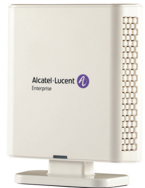
8328 SIP-DECT con soporte