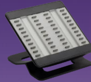
Modules de touches

Personnalisation marque blanche Combiné Bluetooth