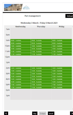
Figure1. Le calendrier visuel