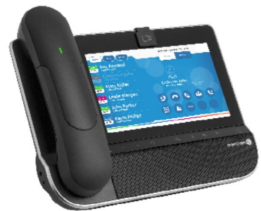
图 2：8088精英版桌面话机上的调度控制台