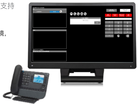
图 1：调度控制台和阿尔卡特朗讯IP话机

调度员可从PC/触摸屏工作站访问Web界面，也可从作为紧凑型调度台的阿尔卡特朗讯8088智能桌面话机访问，这个界面还可轻松集成到第三方控制中心应用中。