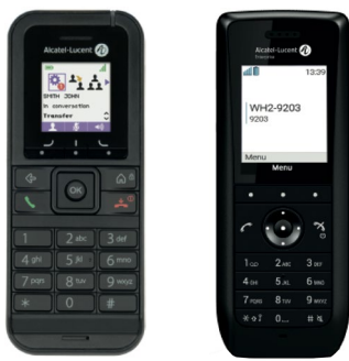
8232 DECT 8168s WLAN