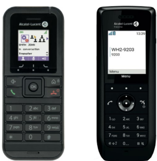
8232 DECT 8168s WLAN