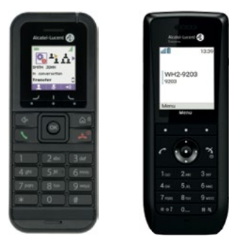
8232 DECT 8168s WLAN