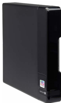
OXO Connect C25