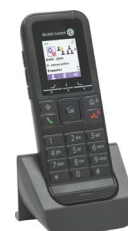
Terminal DECT 8232