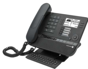
8029s Premium DeskPhone