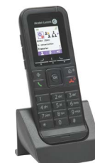
Terminal DECT 8232