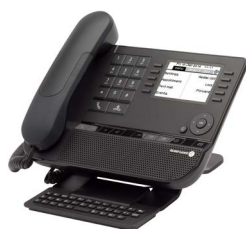
8039s Premium DeskPhone