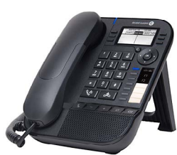
8019s Premium DeskPhone

Comunicações inovadoras, orientadas para o cliente e económicas para pequenas empresas