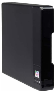
OXO Connect C25