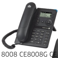
8008 CE8008G CE