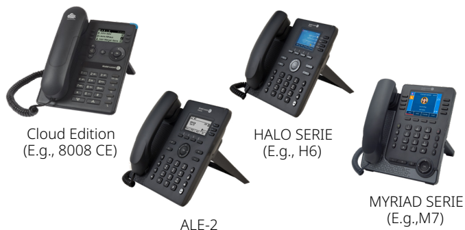
Cloud Edition (E.g., 8008 CE)