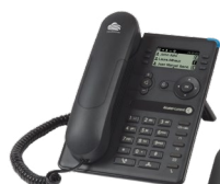
8008 CE 8008G CE