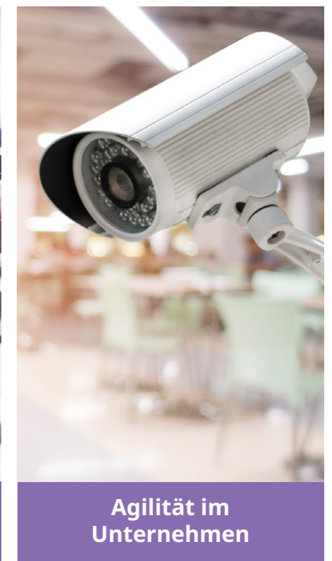
Agilität im Unternehmen