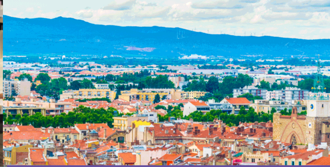
산업: 스마트 도시