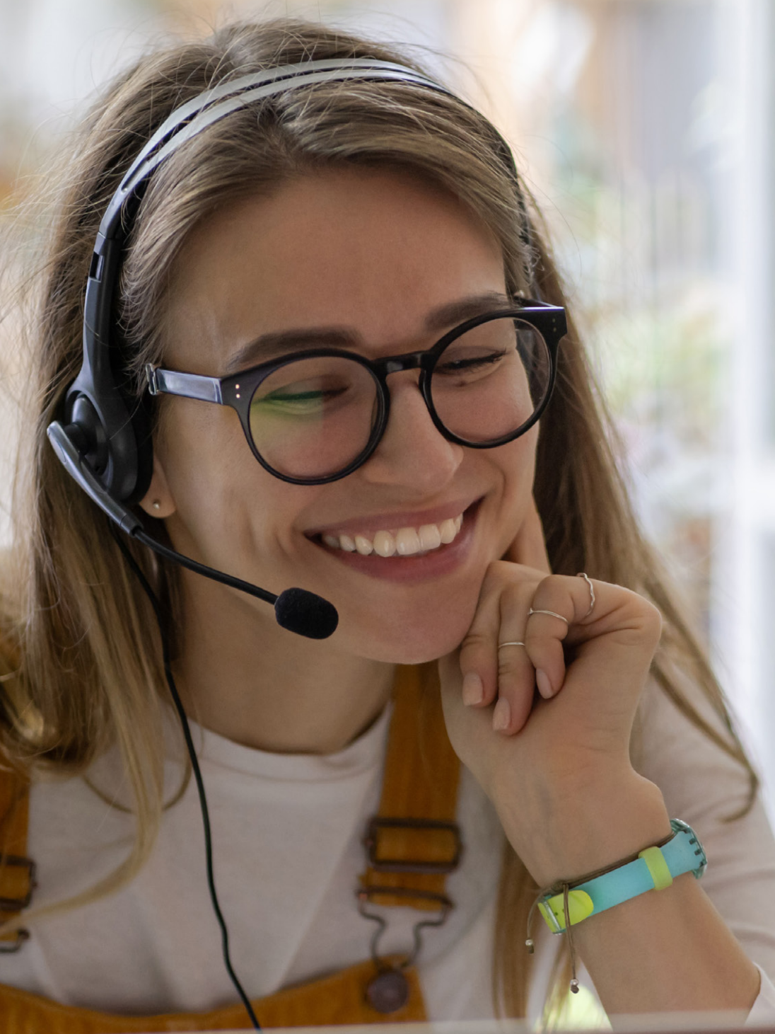
브로슈어 원하는 방식으로 고객과 연결