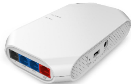
OmniAccess Stellar AP1201H

El punto de acceso multifuncional Alcatel-Lucent OmniAccess® Stellar AP1201H es un punto de acceso muy versátil y de excelente rendimiento que ofrece simplicidad de funcionamiento y una experiencia de usuario de calidad. El punto de acceso WiFi para interiores OmniAccess Stellar AP1201H ofrece un alto rendimiento Gigabit WiFi para aplicaciones en las habitaciones, como en el caso de hoteles, aulas, dormitorios, clínicas y oficinas remotas/domésticas y otros entornos.